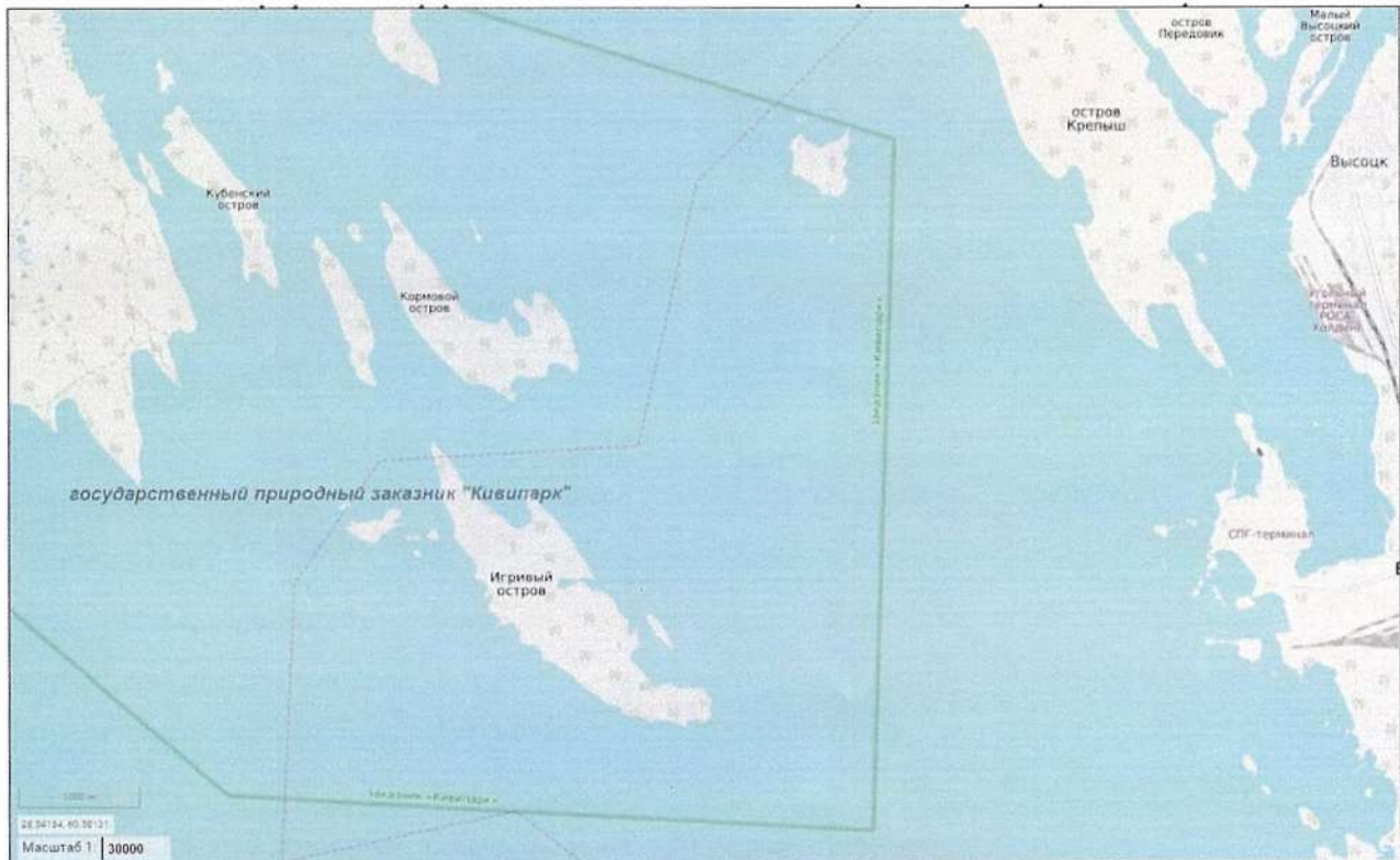
Масштаб 1 : 30 000

*схема подготовлена с использованием РГИС ЛО