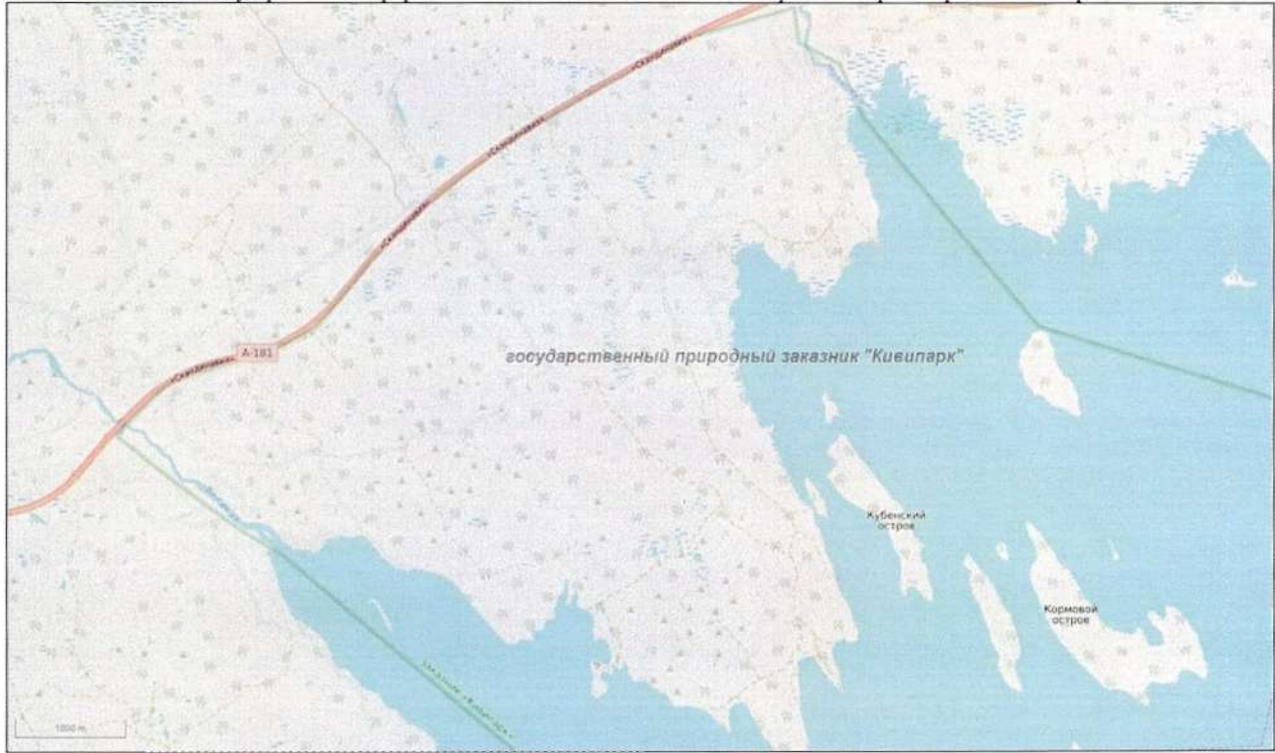
Масштаб 1 : 30 000

*схема подготовлена с использованием РГИС ЛО